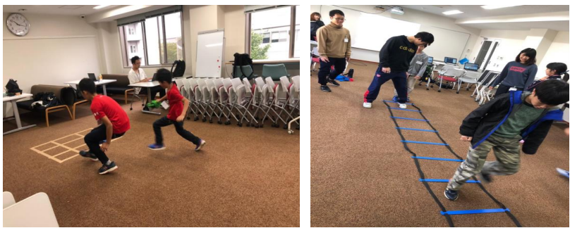
図.1 ミニゲームの風景

研究方法 愛媛大学社会共創学部スポーツ健康マネジメントコース等が運営している総合型地域スポーツクラブ（スポーツ&プログラミング教室）の場を借りて新しいスポーツ教室の形成を行う。ozobotおよびozoblocklyを有効に利用して自分たちの動きや思考をロボットに復元させることによって動きや考えを可視化する。これによって、スポーツとプログラミングをつなぎ合わせることができるようになる。